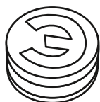
Рисунок 1. Изображение пломбы